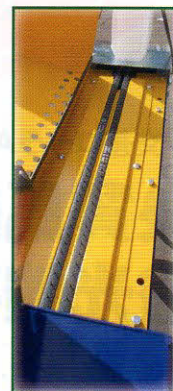
ステンレス針ベルトコンベヤ