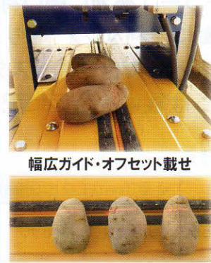
幅広ガイド・オフセット載せ