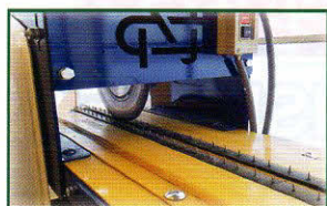
ステンレス回転刃