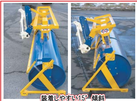
装着しやすい15° 傾斜