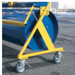
OP:自在ブレーキ付キャスタ ローリング支点・密着式スクレイパー