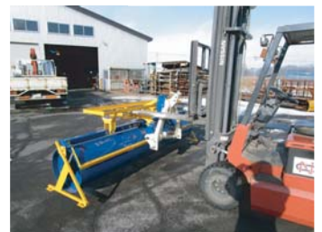
フォークリフト移動も楽々！