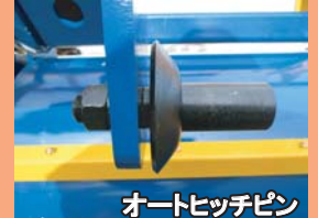
オートヒッチピン

さといも・さつまいも・しょうが・じゃがいも・・・均平鎮圧で出芽良好！除草効果アップ！