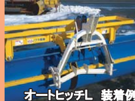
オートヒッチL 装着例