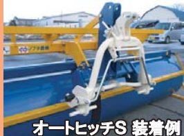
オートヒッチS 装着例