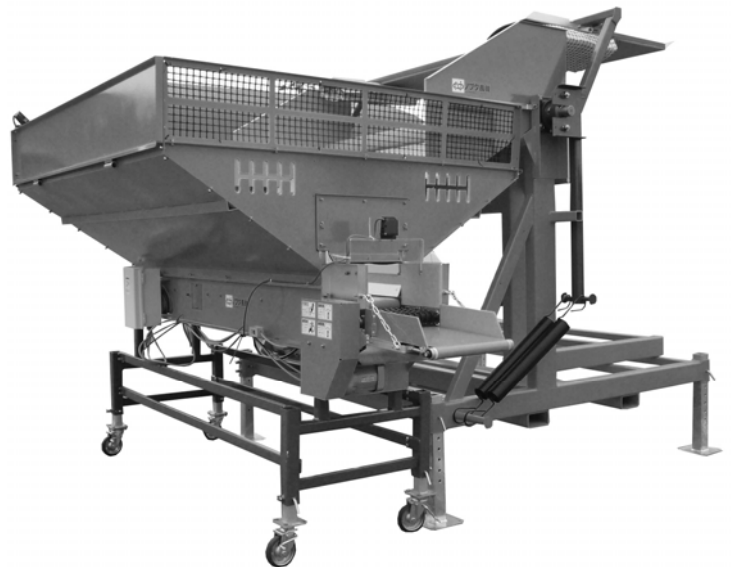
横向きコンテナチッパー+横向きチッパー用フィーダ・サイド (NEBTS+NETCS)