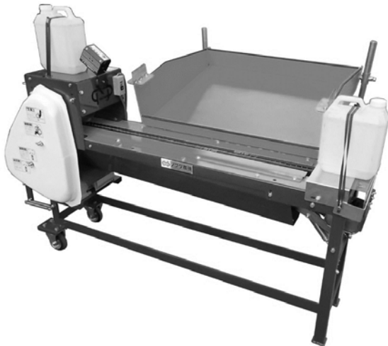
New ! いも種切断機+レーザーマーカ ハイパー+針ベルト消毒装置 (NPC990-LM22-BS1)