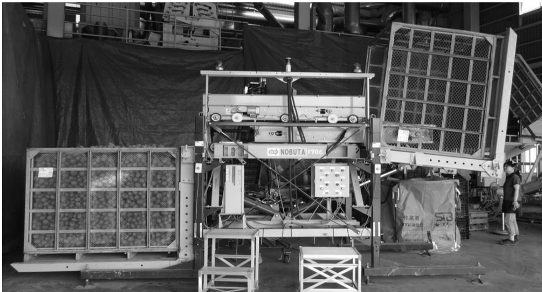
高能率打痕防止収納 コンテナフィーラ NEBFR