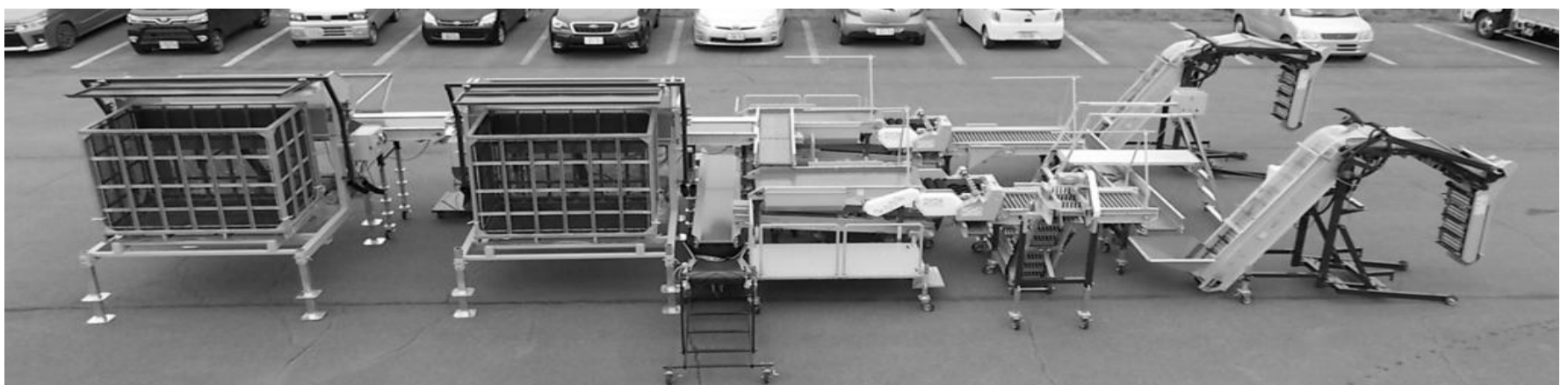
倉庫前選別ライン Wチッパー供給 W列選果 W収納