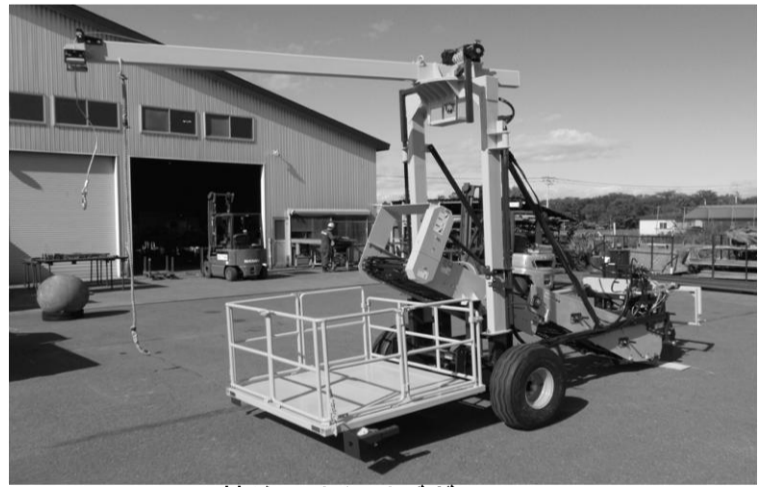
特注 けん引デガー