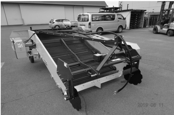
2畦横送りポテトデガー NPW84